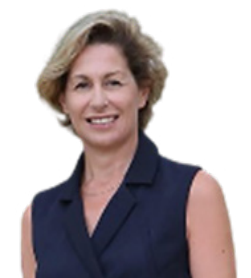
Nathalie Delattre Sénatrice de la Gironde Vice-présidente du Sénat Présidente d'honneur d'Alliance Villes Emploi